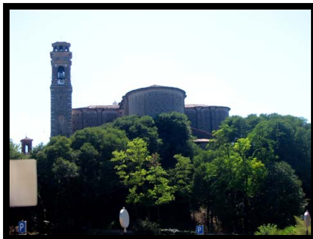
Kirken Chiesa Maggiore i Castiglione delle Stiviere, hvor mange hundrede sårede soldater blev bragt ind efter slaget d. 25. juni 1859. Også mange andre bygninger og private hjem i byen blev brugt som nødlazaretter