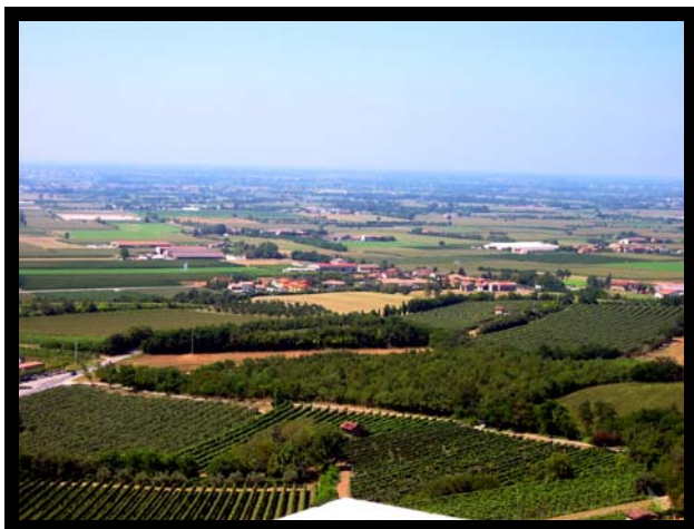
Landskabet omkring Solferino – nu med vin-, majs- og kiwi-marker