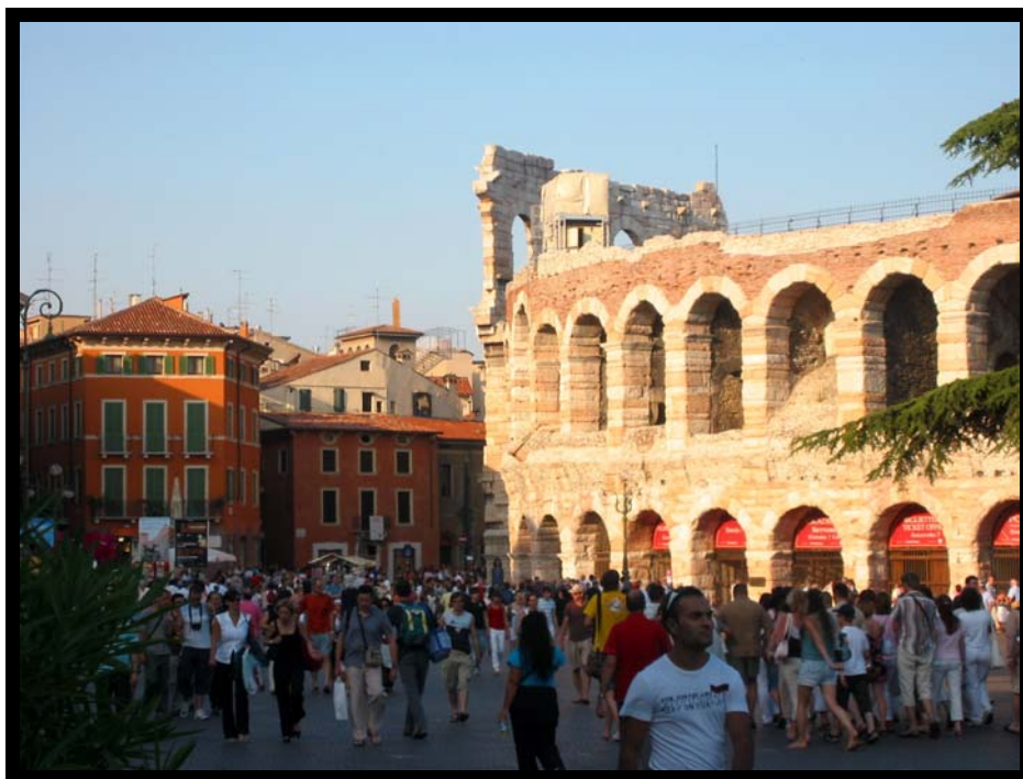
Arenaen i Verona er bygget omkring år 50 e. Kr, og har plads til 22.000 tilskuere

Som tidligere delegat for Internationalt Røde Kors udsendt til Pakistan og Thailand er jeg kendt med historien bag oprettelsen af Røde Kors. Og jeg havde hørt om Henri Dunant, og læst hans bog "Erindringer fra Solferino", med en meget realistisk beskrivelse af krigsførelsen ved det store slag 24. juni 1859. Og nu var chancen kommet for personligt at opleve de historiske steder.