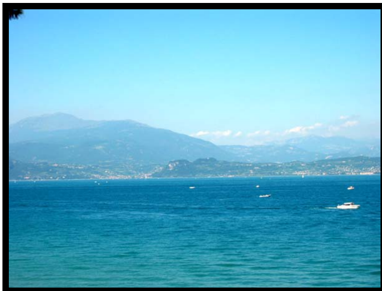
Gardasøen er smuk – dejlige landskaber, charmerende byer, flot natur

I overensstemmelse med sine ønsker blev han begravet uden nogen højtidelighed på Sihlfeld kirkegård i Zürich. I sit testamente skænkede han penge til plejehjemmet i Heiden for at sikre, at der altid stod en seng klar til en fattig indbygger fra regionen. Han testamenterede også penge til venner og velgørende organisationer i Norge og Schweiz. De resterende midler gik til hans kreditorer for delvis at indfri hans gæld. At han aldrig fik mulighed for at indfri hele sin gæld var en stor byrde for ham helt til hans død. Hans fødselsdag 8. maj bliver fejret som Verdens Røde Kors og Røde Halvmåne-dag . Sygehjemmets bygning er i dag Henry Dunant-museum. I Geneve og andre steder er utallige gader, gadehjørner og skoler opkaldt efter ham, og Røde Kors-bevægelsens højeste udmærkelse, Henry Dunant-medaljen, uddeles hvert andet år af den siddende bestyrelse for det Internationale Røde Kors og Røde Kors-bevægelsen.