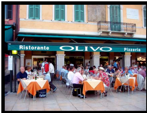
Aftensmad på Piazza Bra før "Aida"